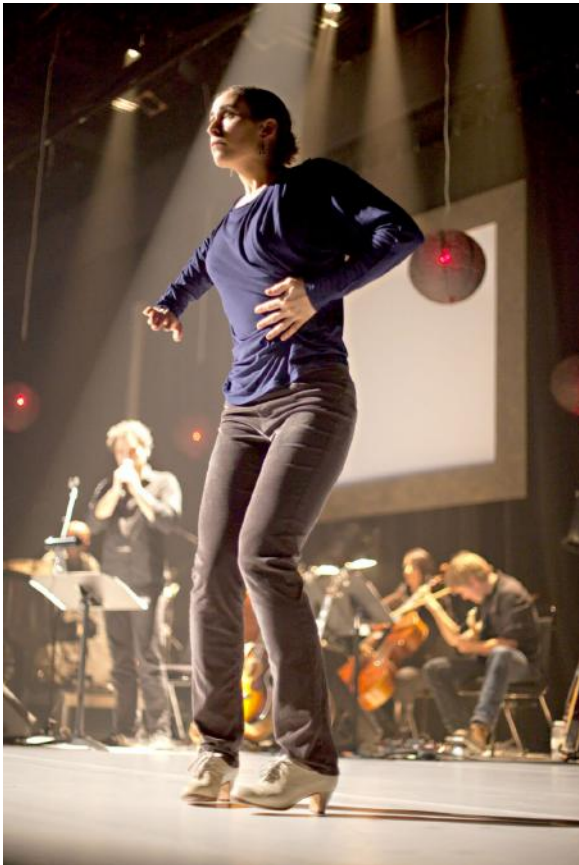
Des chorégraphies en l'honneur de Lhasa de Sela